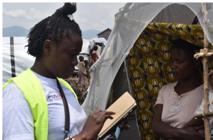
ENREGISTREMENT DES PREMIERS ARRIVANTS SUR LES SITES LORS DU DÉBUT DE LA CRISE DU M23

Pour une explication détaillée du fonctionnement et des méthodologies de la DTM, veuillez vous référer au cadre méthodologique .