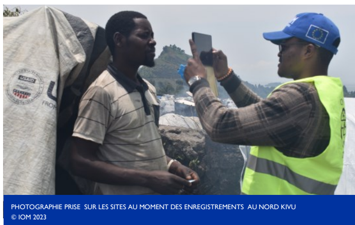
PHOTOGRAPHIE PRISE SUR LES SITES AU MOMENT DES ENREGISTREMENTS AU NORD KIVU