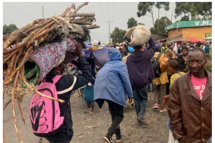
MOUVEMENT DE POPULATION AU COURS DE L'ÉVALUATION DE LA CRISE M23 AU NORD KIVU

Au-delà du contexte d'urgence, la DTM, à l'ère du Triple Nexus, soutient un éventail d'acteurs intervenant dans les domaines de la prévention, du relèvement et du développement en fournissant des données de référence fiables, des évaluations thématiques ciblées et des enquêtes. En 2023, grâce à ses partenaires et donateurs, la DTM a fourni des informations clés, détaillées et actualisées sur les caractéristiques et les besoins des populations affectées par les crises multidimensionnelles. Cela a été réalisé à travers des évaluations rapides, des opérations d'enregistrement, le suivi de la mobilité et des flux, ainsi que des évaluations sur les solutions durables et l'indice de stabilité. En 2024, l'OIM continuera à renforcer et optimiser ses actions pour positionner la DTM comme l'outil de référence pour évaluer les mouvements de population en RDC.