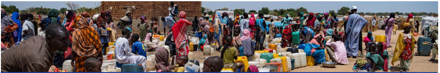
Des personnes déplacées en provenance du Soudan s'alignent pour puiser de l'eau à Adré, à l'Est du Tchad.

retournés ont reçu une assistance en abris