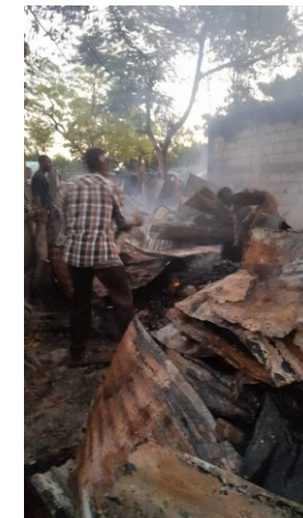
Incendie dans le site St Monfort