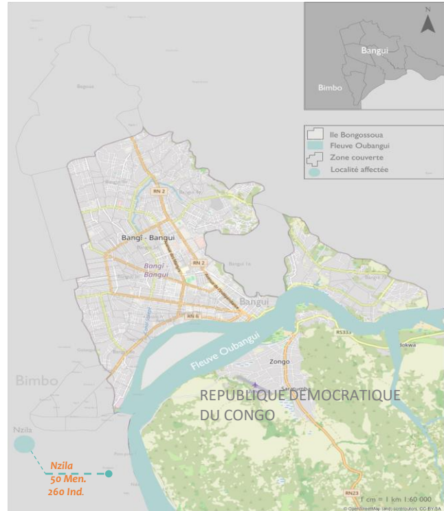
Cette carte n’est fournie qu’à titre d’illustration. Les représentations ainsi que l’utilisation des frontières et des noms géographiques sur ces cartes peuvent comporter des erreurs et n’impliquent ni jugement sur le statut légal d’un territoire, ni reconnaissance ou acceptation officielle de ces frontières de la part de l’OIM.