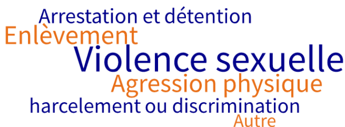
Figure 1: Risques de sécurité rapportés pour l'accès aux latrines

Le tableau ci-dessous indique le pourcentage de sites où un risque de protection spécifique a été signalé. En outre, il souligne la sous-préfecture où le risque a été le plus fréquemment mentionné.