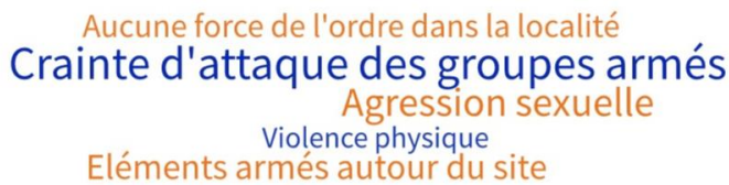
Figure 1: Risques de sécurité rapportés pour femmes