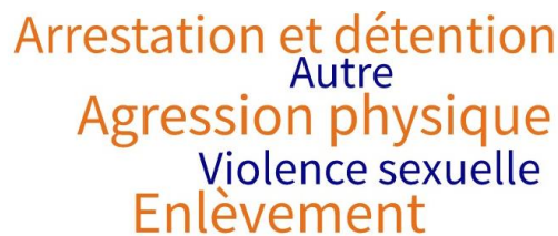
Figure 3: Risques de sécurité rapportés pour l'accès aux champs

Dans 55 pour cent des sites , l'agression physique et la violence sexuelle sont les risques liés aux activités agricoles les plus mentionnés.