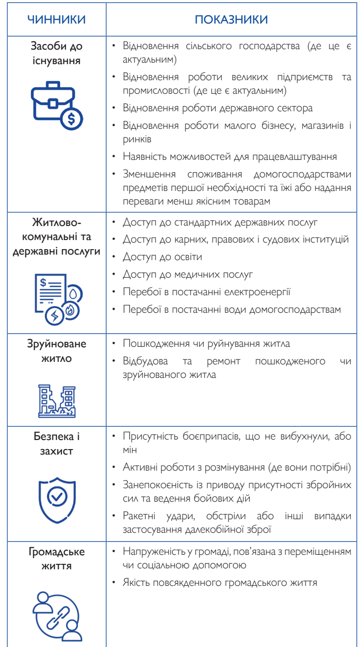
Таблиця 1. Перелік вибраних показників структурних і соціальних умов

Кожному секторальному показнику присвоєно «оцінку тяжкості умов повернення», тобто відносної повідомленої відсутності критичних фізичних і соціальних умов існування, які сприяють стійкій реінтеграції. Наприклад, у ході оцінювання респондентам ставили запитання: «Котра із запропонованих ситуацій найкраще описує звичайне громадське життя у вашому населеному пункті зараз?»