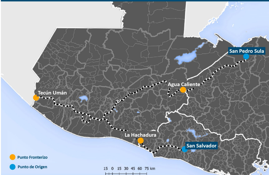
RUTA DE PERSONAS MIGRANTES EN TRÁNSITO 16-01-2019