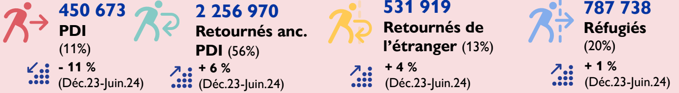
Nombre de retournés anciennement PDI, par année