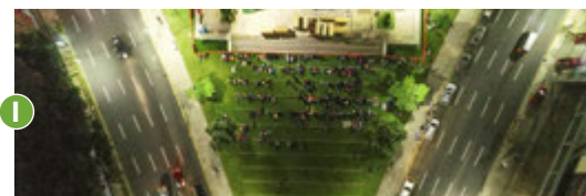
Punto de reunión: Monumento al Divino Salvador del Mundo. Las personas empezaron a llegar el 30-10-2018 por la noche.