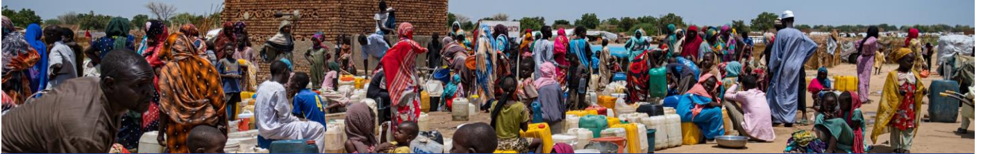
Des personnes déplacées en provenance du Soudan s'alignent pour puiser de l'eau à Adré, à l'Est du Tchad.