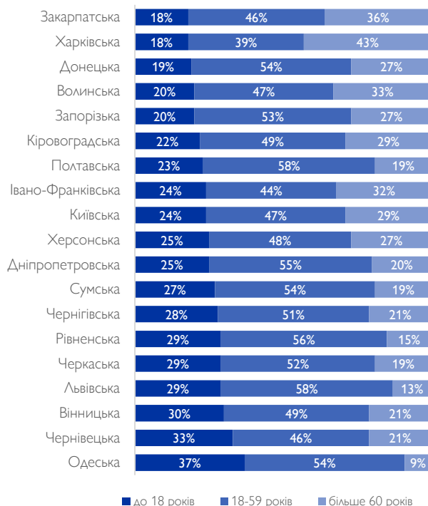
Рис. 1: Віковий розподіл серед зареєстрованих ВПО за областями.

■ до 18 років ■ 18-59 років ■ більше 60 років