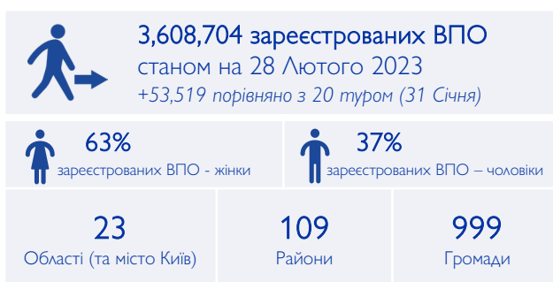
Присутність зареєстрованих ВПО за районами станом на 28 лютого 2023