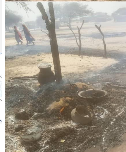
Incendie à Medi koura