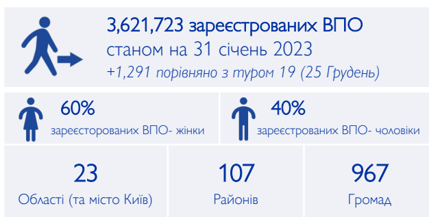
Присутність зареєстрованих ВПО за районами станом на 31 січня 2023