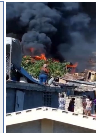
Incendie à Fort-National