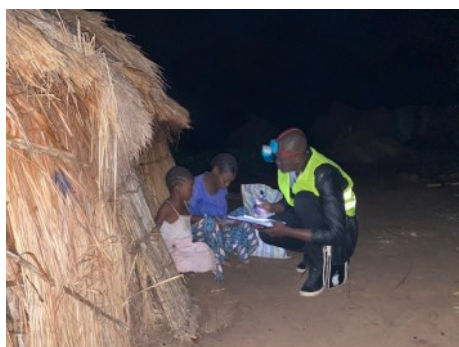
ENREGISTREMENT NOCTURNE DE LA POPULATION EN ITURI

L'enregistrement est une composante clé de la DTM qui permet de collecter des données détaillées sur les personnes déplacées, les besoins humanitaires les plus urgents et les vulnérabilités. Les données d'enregistrement collectées ont pour but de soutenir les efforts visant à améliorer les conditions de vie des populations déplacées dans les sites de déplacement.