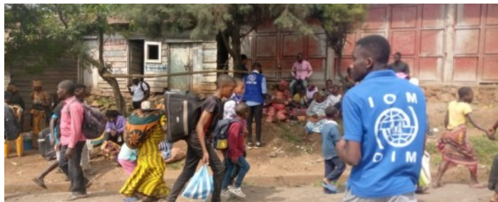
ÉVALUATION RAPIDE DES MOUVEMENTS ZONE DE SANTÉ DE BUNYAKIRI, SUD KIVU

Le suivi des urgences de la DTM en RDC est une fonction qui permet de surveiller en temps réel les crises, ses conséquences et les activités menées par les acteurs humanitaires et les autorités nationales. Ce mécanisme vise à compléter les évaluations de base sur la veille humanitaire en fournissant des informations fiables et en temps réel sur les mouvements soudains de population, notamment sur l'ampleur et les dynamiques du mouvement, l'emplacement des personnes déplacées, les raisons du mouvement et les besoins humanitaires de base. Ce mécanisme d'évaluation rapide multisectoriel permet d'informer les partenaires et de garantir que l'aide fournie soit appropriée, efficace et rapide. En particulier, le système de suivi des urgences de l'OIM a été largement utilisé à la suite de l'éruption du volcan Nyiragongo en 2021 et lors des crises CODECO et M23, pour informer et appuyer les acteurs humanitaires et autorités nationales à apporter une réponse rapide et adaptée à l'ampleur des différentes crises.