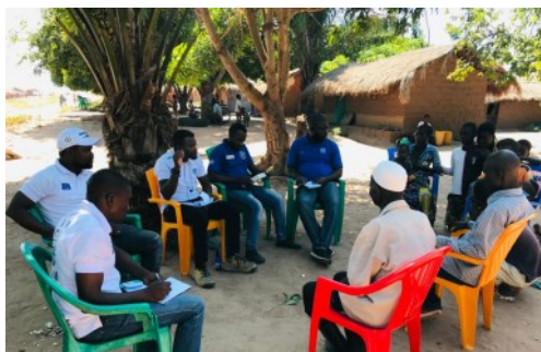
ENQUÊTE AUPRÈS DES INFORMATEURS CLÉS AU TANGANYIKA

Le suivi de la mobilité (mobility tracking) est une composante de la DTM, mise en œuvre en RDC en 2017, qui consiste à recueillir des données sur le nombre, les emplacements et les profils des personnes déplacées et plus précisément sur les raisons du déplacement, les zones d'origines, les