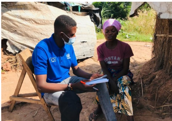
ENQUÊTES SUR LES INTENTIONS DE RETOUR DANS LES SITES DU TANGANYIKA

La DTM est un outil multisectoriel qui s'adapte systématiquement au contexte et aux besoins d'information sollicités. Les enquêtes sont ciblées et sont conçues pour offrir des informations précises et détaillées sur des thématiques spécifiques qui ne sont pas couvertes par les évaluations conventionnelles. Au cours de l'année 2022, la composante enquête de la DTM a été utilisée pour mesurer l'efficacité d'un programme ou d'une approche ou pour compléter des informations sur les populations déplacées afin d'apporter une réponse humanitaire adaptée. En particulier, les enquêtes d'intention menées en RDC par la DTM apportent des informations sur les raisons initiales du déplacement, les motivations pour rester sur le lieu du déplacement, les conditions préalables au retour, la situation dans les zones de retour, la relation et la perception entre les déplacés et la communauté d'accueil, et évaluent les besoins de la population affectée. De plus, la DTM entreprend des évaluations de vulnérabilité pour prioriser, adapter et cibler l'assistance en fonction du degré de vulnérabilité des personnes. L'OIM, par le biais de DTM, continuera à mener des enquêtes pour fournir des informations aux partenaires humanitaires et gouvernementaux engagés dans la planification et la réponse aux situations d'urgence, la transition et le développement.