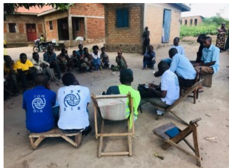
ÉVALUATION DANS LES ZONES DE RETOUR

La RDC a été marquée par des événements conflictuels provoquant des instabilités, des tensions et des violences, qui ont eu un impact négatif sur la cohésion sociale, la cohabitation pacifique entre les différents groupes sociaux et la recherche de solutions durables pour les communautés affectées. Néanmoins, ces dernières années, la RDC a connu des améliorations notables