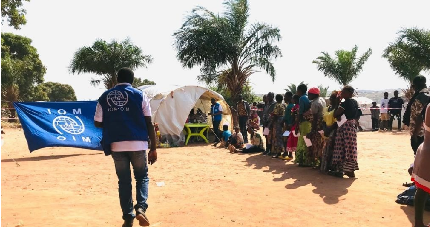
ENQUÊTE D'INTENTION ET ACCOMPAGNEMENT AU RETOUR DES PERSONNES DÉPLACÉES AU TANGANYIKA