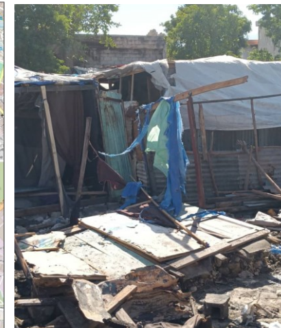
Incendie à Airpot Ciné