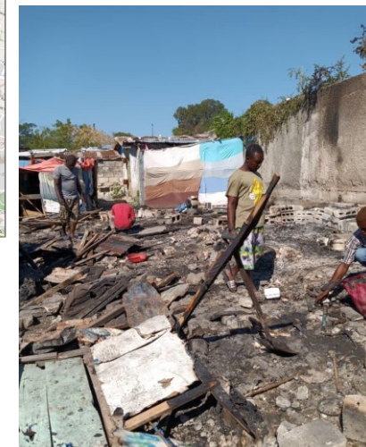
Incendie à Airpot Ciné