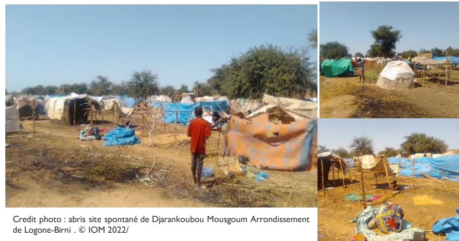
Credit photo : abris site spontané de Djarankoubou Mousgoum Arrondissement de Logone-Birni . © IOM 2022/