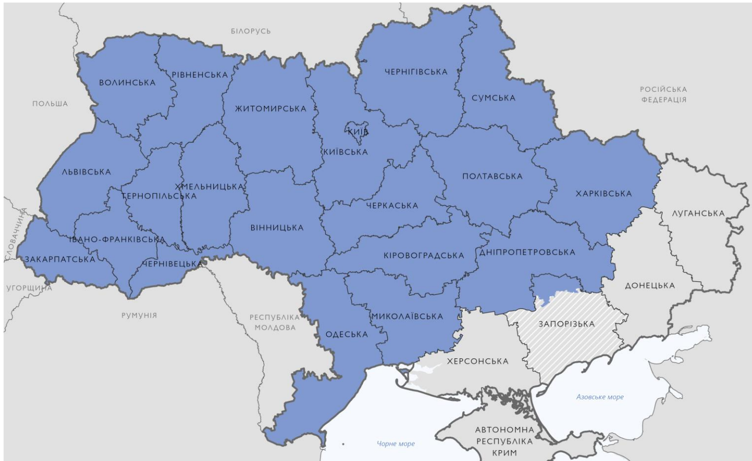
Карта 1. Покриття 12-го туру командою МВП на обласному рівні в Закарпатській, Львівській, Івано—Франківській, Харківській, Миколаївській, Черкаській, Чернівецькій, Чернігівській, Хмельницькій, Волинській, Вінницькій, Сумській, Рівненській, Житомирській, Кіровоградській, Київській, Запорізькій, Полтавській, Одеській, Тернопільській, Дніпропетровській областях та в місті Києві

Щоб дізнатися більше про тенденції переміщення населення в Україні, перегляньте загальне опитування населення MOM в Україні, яке надає оцінки на національному та макрорегіональному рівнях, а також уявлення про людську мобільність і потреби за допомогою телефонних опитувань та підходу рандомізованої вибірки. Ці базові звіти доповнюють загальне опитування населення, висвітлюючи розподіл внутрішньо переміщеного населення в межах областей на рівні громад.