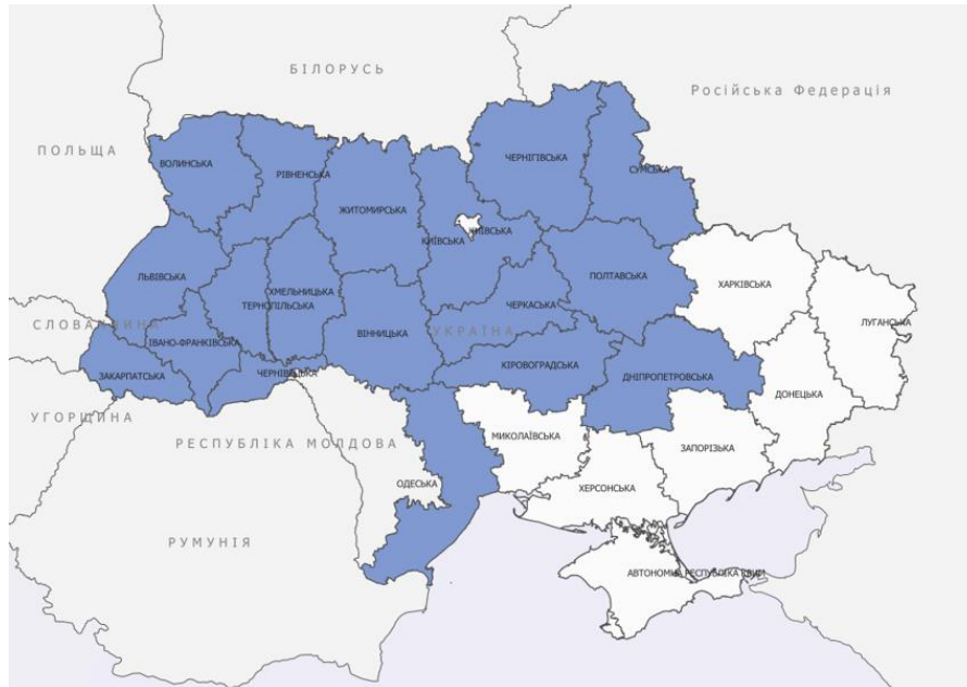
Карта 1. Покриття 8-го туру командою МВП на обласному рівні в Закарпатській, Львівській, Івано—Франківській, Черкаській, Чернівецькій, Чернігівській, Хмельницькій, Волинській, Вінницькій, Сумській, Рівненській, Житомирській, Кіровоградській, Запорізькій, Полтавській, Одеській, Тернопільській, Дніпропетровській та Київській областях

Щоб дізнатися більше про тенденції переміщення населення в Україні, перегляньте загальне опитування населення МОМ в Україні, яке надає оцінки на національному та макрорегіональному рівнях, а також уявлення про людську мобільність і потреби за допомогою телефонних опитувань та підходу рандомізованої вибірки. Ці базові звіти доповнюють загальне опитування населення, висвітлюючи розподіл внутрішньо переміщеного населення в межах областей на рівні громад.