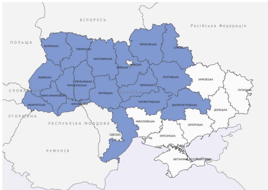
Карта 1. Покриття 6-го туру командою МВП на обласному рівні в Закарпатській, Львівській, Івано—Франківській, Черкаській., Чернівецькій, Чернігівській, Хмельницькій, Волинській, Вінницькій, Сумській, Рівненській, Житомирській, Кіровоградській, Полтавській, Одеській, Тернопільській, Дніпропетровській та Київській областях

Щоб дізнатися більше про тенденції переміщення населення в Україні, перегляньте загальне опитування населення МОМ в Україні, яке надає оцінки на національному та макрорегіональному рівнях, а також уявлення про людську мобільність і потреби за допомогою телефонних опитувань та підходу рандомізованої вибірки. Ці базові звіти доповнюють загальне опитування населення, висвітлюючи розподіл внутрішньо переміщеного населення в межах областей на рівні громад.