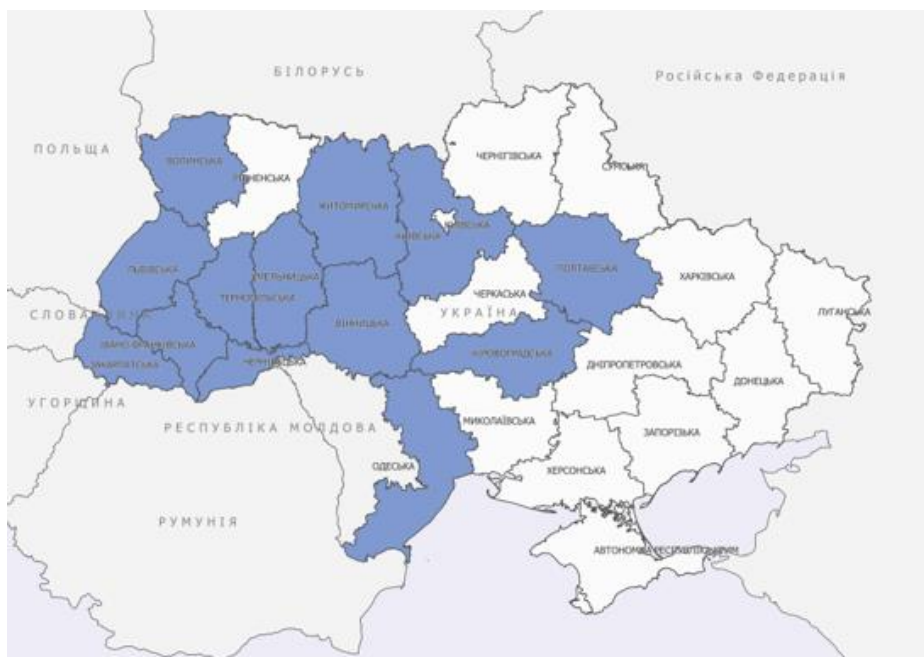
Карта 1. Покриття 5-го туру командою МВП на обласному рівні в Закарпатській, Львівській, Івано–Франківській, Чернівецькій, Хмельницькій, Волинській, Вінницькій, Житомирській, Кіровоградській та Полтавській, Одеській, Тернопільській, Київській областях

Щоб дізнатися більше про тенденції переміщення населення в Україні, перегляньте загальне опитування населення МОМ в Україні, яке надає оцінки на національному та макрорегіональному рівнях, а також уявлення про людську мобільність і потреби за допомогою телефонних опитувань та підходу рандомізованої вибірки. Ці базові звіти доповнюють загальне опитування населення, висвітлюючи розподіл внутрішньо переміщеного населення в межах областей на рівні громад.