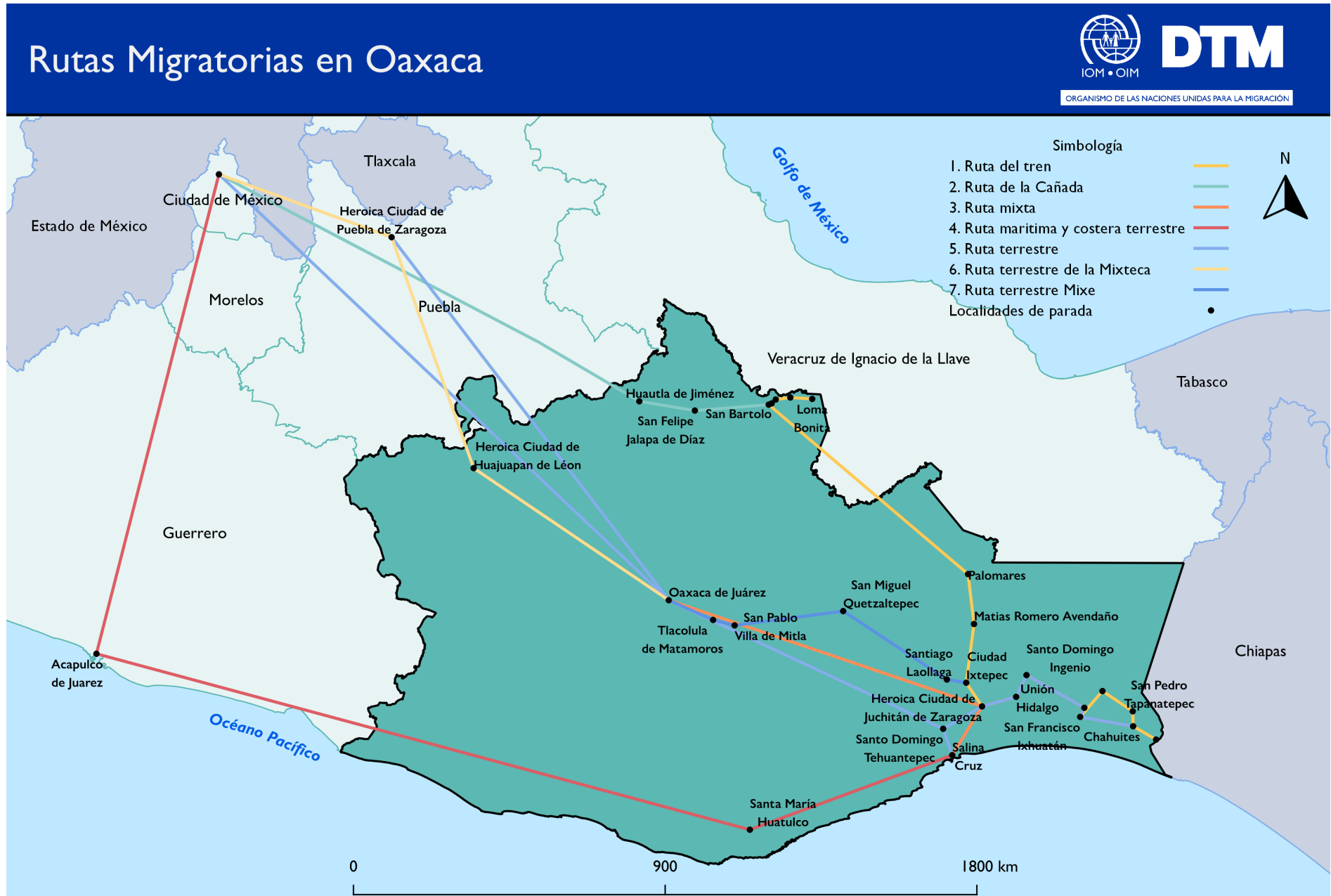
Figura 2. Mapa general de las rutas migratorias en Oaxaca