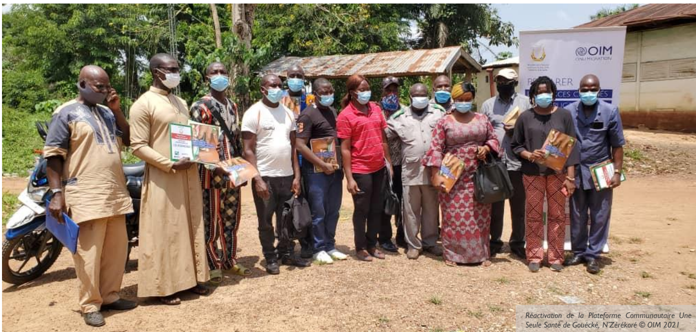
Réactivation de la Plateforme Communautaire Une Seule Santé de Gouécké, N'Zérékoré

La réactivation de cette PCUSS a été rendue possible grâce à l'appui de l'OIM à travers le projet PrePLine, financé par le département d'Etat Américain.