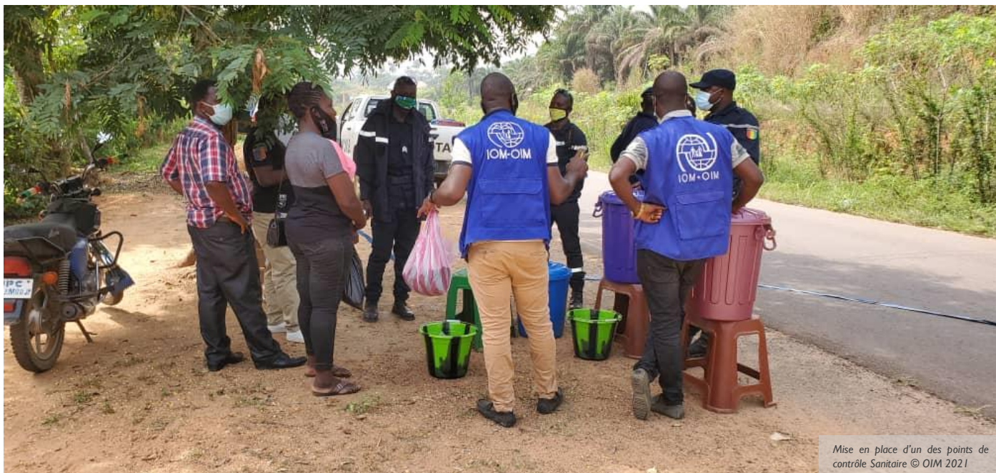
Mise en place d'un des points de contrôle Sanitaire

N'Zérékoré le 3 Mars 2021 : installation de 4 Points de Contrôle Sanitaire (PCS) aux principales sorties de la Commune Urbaine (CU). Pour contribuer à rompre la chaîne de transmission de la MVE dans le district sanitaire de N'Zérékoré, l'OIM a appuyé ce jour l'installation de 4 PCS aux principales sorties de la CU. Au niveau de chaque PCS, les agents des Unités de Protection Civile (UPC), les Relais Communautaires (RECO) et les Agents Techniques de Santé (ATS) déployés sont chargés de prendre de façon systématique la température de tous les passagers, les soumettre au lavage des mains, les sensibiliser sur les mesures de prévention contre la MVE et d'enregistrer les passagers sortants de la CU pour un suivi éventuel.