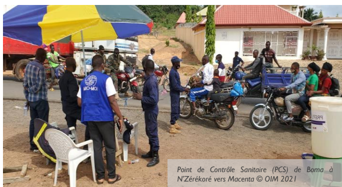
Point de Contrôle Sanitaire (PCS) de Boma à N'zérékoré vers Macenta

La Guinée fait face, depuis février 2021, à la réapparition de l'épidémie d'Ebola. Pour la première fois depuis 2016, des cas de fièvre hémorragiques causés par le virus ont été recensés dans la préfecture de N'zérékoré, dans le sud-est du pays, conduisant à plusieurs morts. La première victime, identifiée dans la sous-préfecture de Gouécké, est une infirmière décédée fin janvier. Tous les autres cas sont des personnes ayant assisté aux obsèques le 1 er février 2021. Le 14 février, le Ministère de la Santé de Guinée a officiellement déclaré une épidémie de maladie à virus Ebola (MVE).