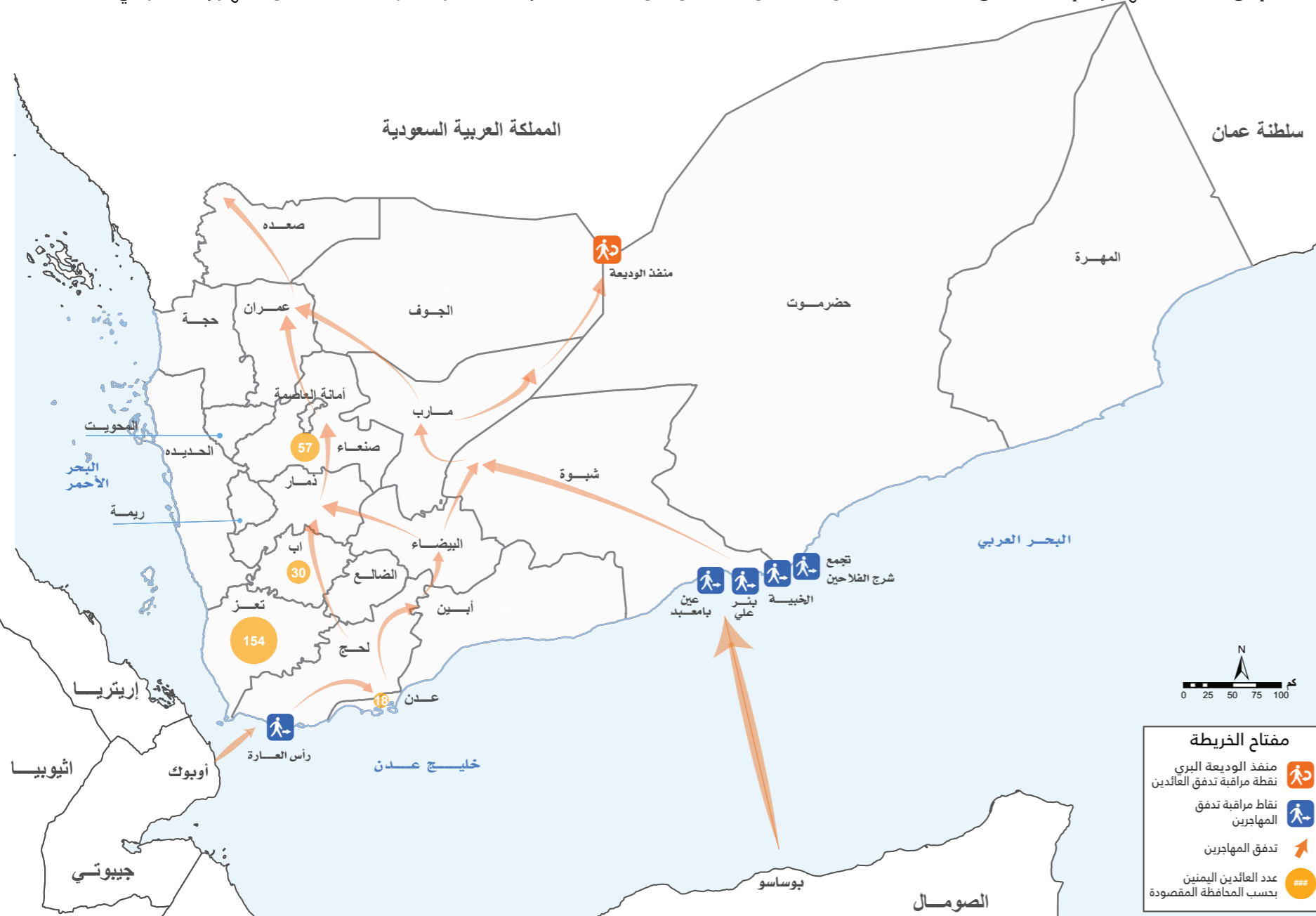
توضيح: هذه الخريطة هي لأغراض الإيضاح فقط، ولا تُشير الأسماء أو الحدود المرسومة على هذه الخريطة الموافقة الرسمية أو القبول من جانب المنظمة الدولية للهجرة